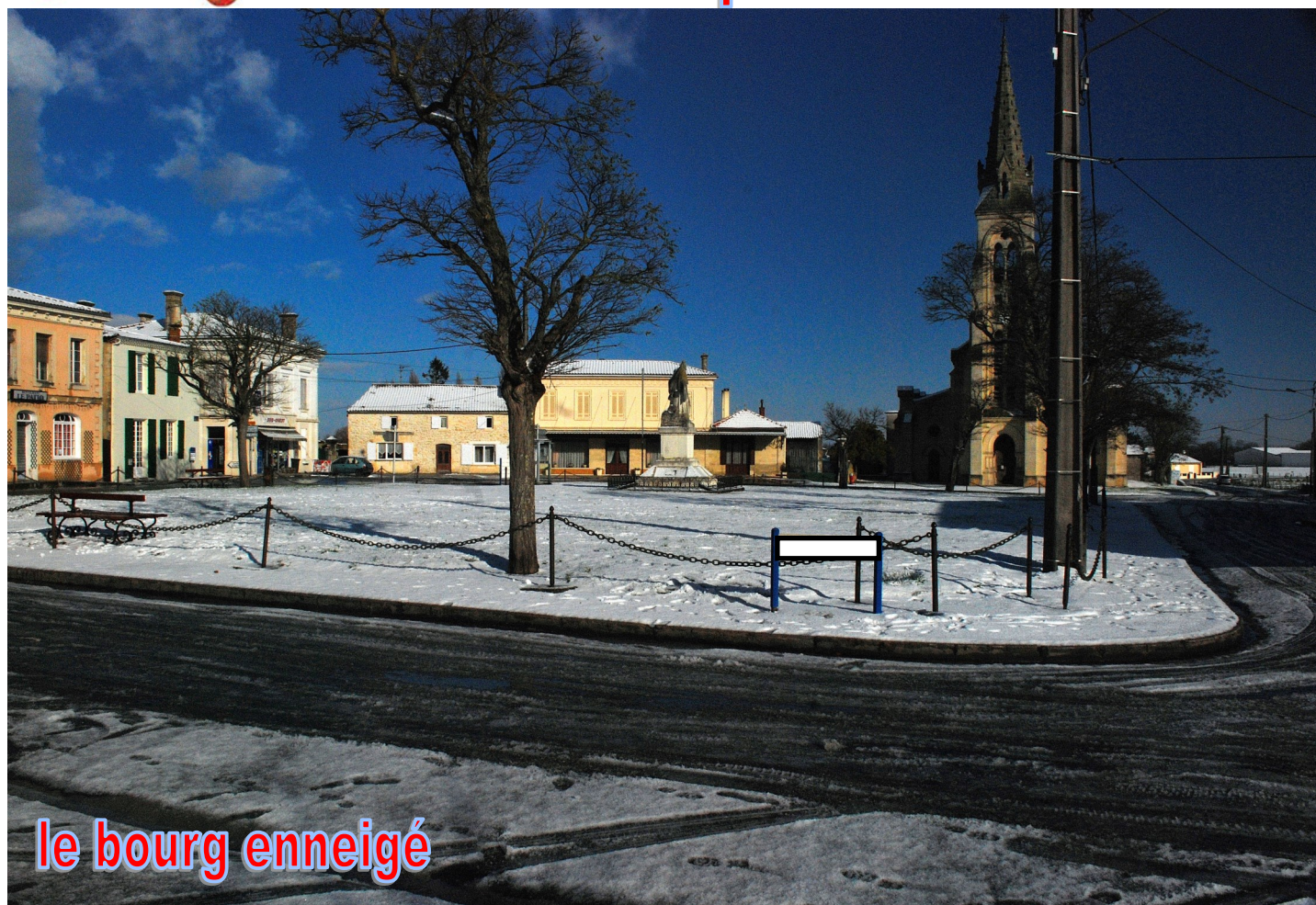
le bourg enneigé