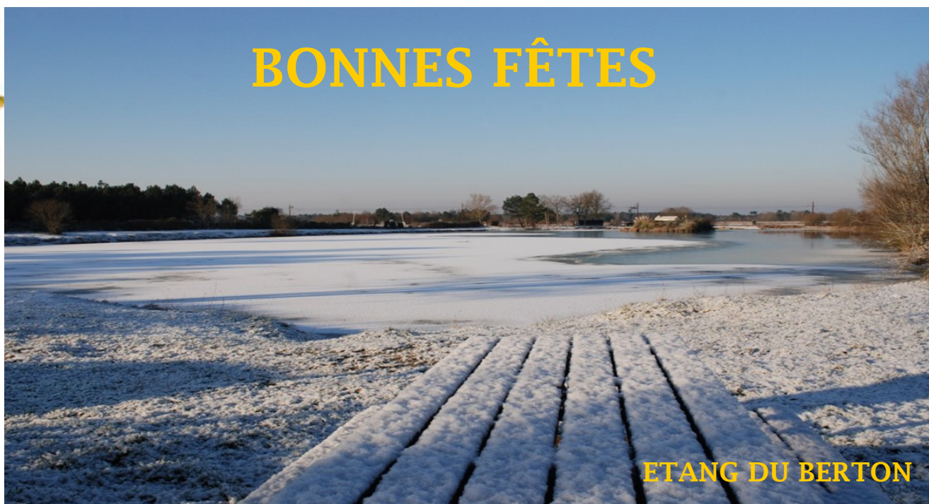
ETANG DU BERTON

« Pre Senta Lúcia, un pè de piutz; pre Nadau, un pè de veguèir e prau Cap d'an, un pè de beu.»