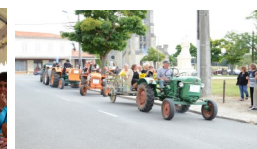
Fête de la St Roch au stade en août