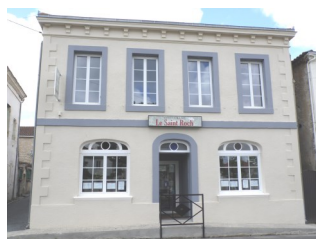
Le restaurant ST ROCH s'est mis en couleur