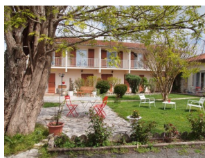
Nouveau propriétaire à l'hôtel des Vieux Acacias