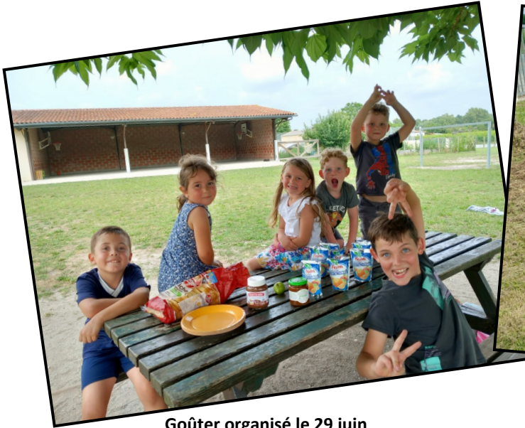
Goûter organisé le 29 juin