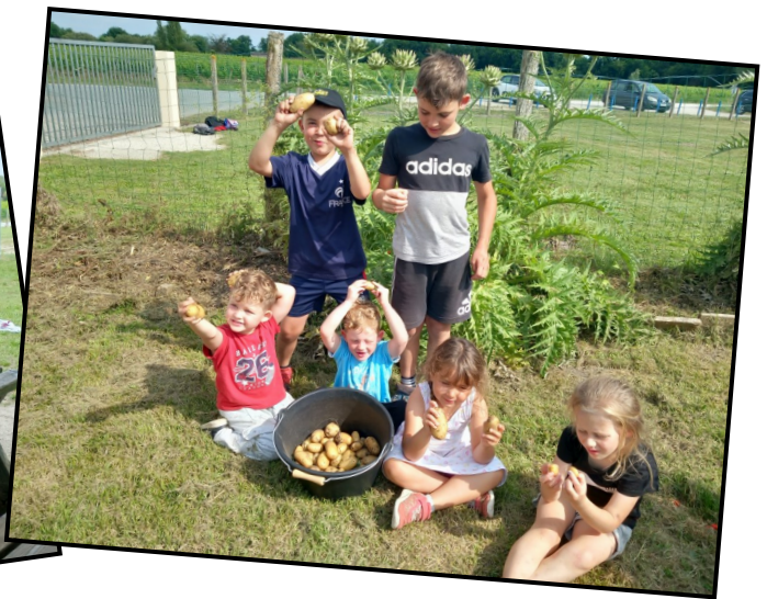
Récolte miraculeuse des pommes de terre partagée avec les enfants