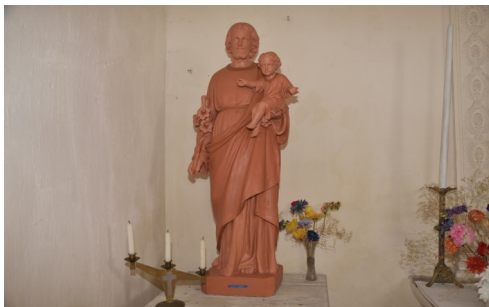
restaurée par Monsieur VILLAIN