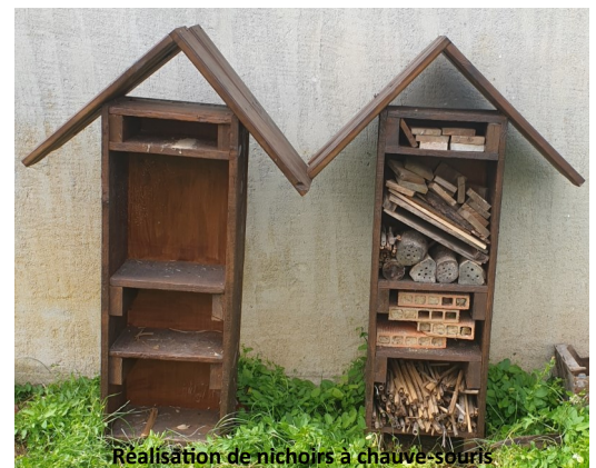
Réalisation de nichoirs à chauve-souris

Cette matinée d'éco nettoyage sera suivie d'un moment de convivialité à la salle des fêtes autour du pot de l'amitié. Venez nombreux !