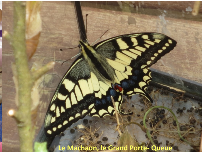
Le Machaon, le Grand Porte-Queue

Voici une des activités de l'année racontée par les élèves de petite section :